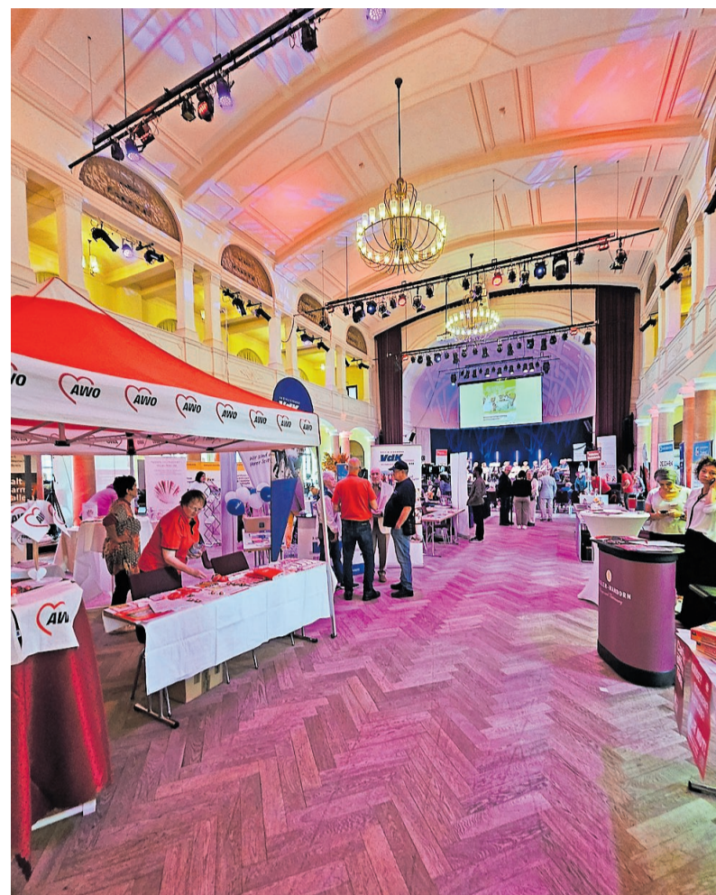
Der Hauptraum der Fruchthalle kurz vor der Eröffnungszeremonie