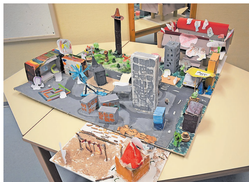
Das detailgenaue Modell der Kita Kinderwelt hat den Sonderpreis gewonnen