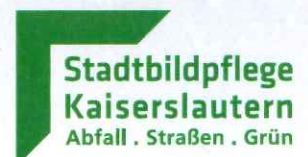
Rainer Grüner Werkleiter